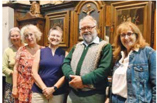
Hannert dem Altar