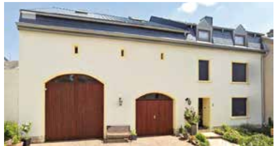
Schiilzhaus zu Giewel